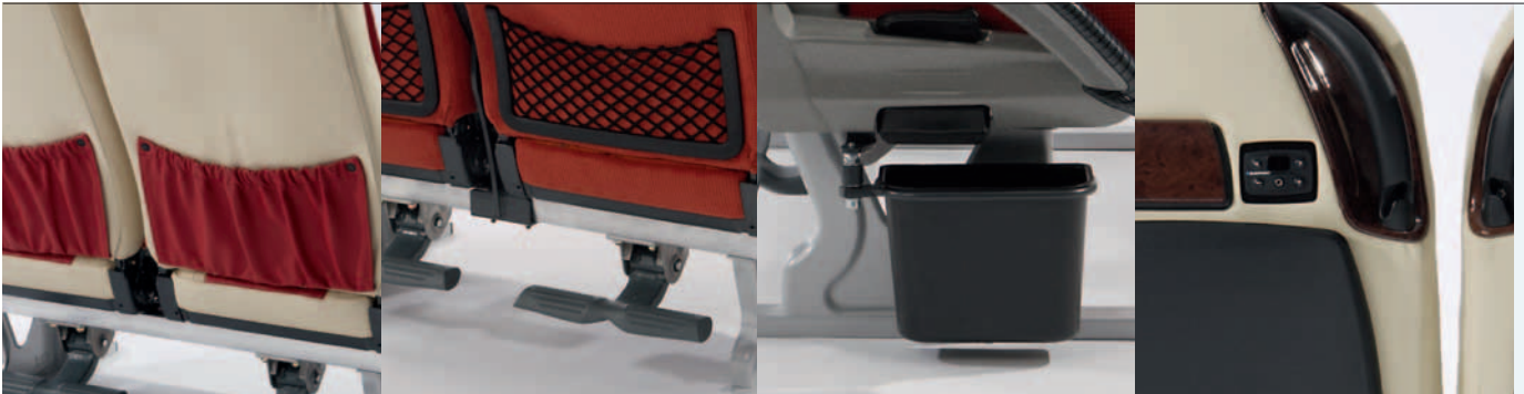
11 Audiomodul Audio module Commande pour réglage audio

Die vielfältigen, optionalen Anbauteile bieten die Möglichkeit den Sitz wunschgemäß auszustatten.