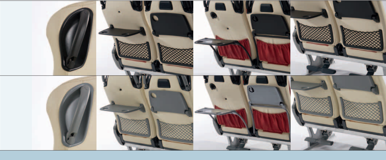
07 Zeitungsnetz Magazine net Filet porte-revues