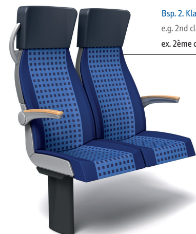
Bsp. 2. Klasse e.g. 2nd class ex. 2ème classe

Das ergonomische und designtechnisch anspruchsvolle Sitzsystem MATCH erzeugt einen besonders hohen Wohlfühleffekt beim Sitzen. Das modulare Sitzsystem überzeugt zudem nicht nur durch seine hohe Funktionalität und den hervorragenden Sitzkomfort, sondern erfüllt Dank seiner modernen und neuartigen Form auch höchste optische Ansprüche.