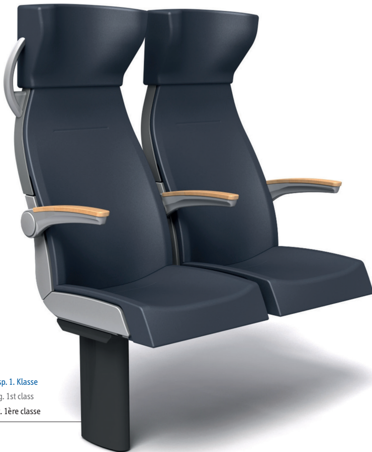
Bsp. 1. Klasse e.g. 1st class ex. 1ère classe

DESIGN INNOVANT POUR LE TRANSPORT RÉGIONAL